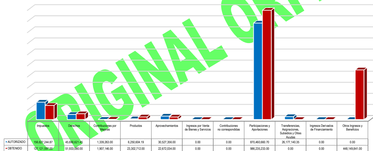
Gráfico 4. Ingresos